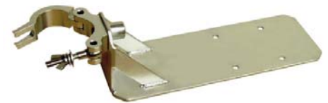
Beslag for fastgørelse på rør

Kontakt venligst DESITEK A/S for yderligere information om disse produkter.